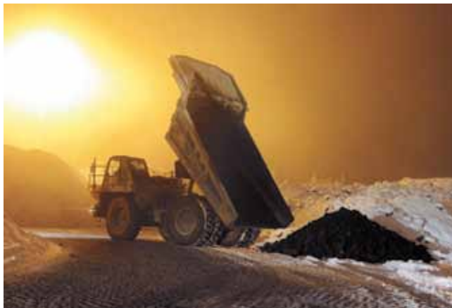
Suurikuusikon avolouhoksen viimeinen malmikuorma 6.11.2012