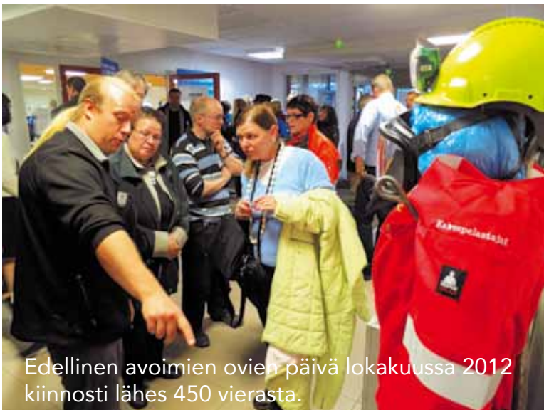
Edellinen avoimien ovien päivä lokakuussa 2012 kiinnosti lähes 450 vierasta.

Kaivosyhtiö järjestää avoimien ovien päivän lauantaina 24. elokuuta klo 10–15 Levi-instituutin tiloissa Kittilässä. Päivän aikana yhtiö esittelee Kittilän kaivosta ja malminetsintää sekä tarjoaa mukavaa puuhaa myös perheen pienimmille Levi-instituutin opiskelijoiden avustuksella. Kittilästä järjestetään linja-autoilla opastetut tutustumiskäynnit kaivokselle.