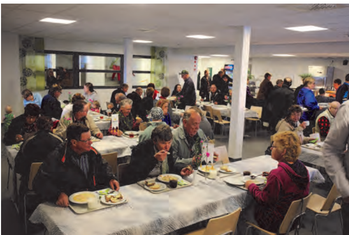
Uuden kaivoskonttorin henkilöstöravintola Kaivari

Kittilän kaivos avasi jälleen ovensa vieraille. Elokuisena lauantapäivänä kaivokseen tutustui lähes 400 kävijää. Ohjelmassa oli yleisesittelyn lisäksi kiertoajelut kaivosalueella sekä osastojen esittelyt.