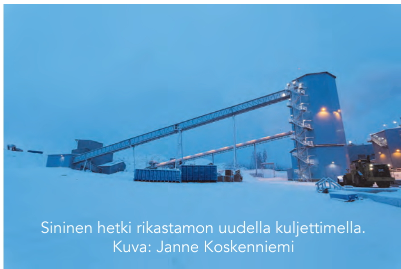
Sininen hetki rikastamon uudella kuljettimella.